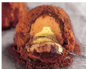
D12. TARTUFO CLASSICO € 5,00