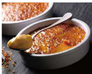
D15. CREMA CATALANA IN COCCIO € 5,00