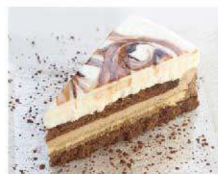
D22. CHOCOLATE TRILOGY PRECUT € 4,50