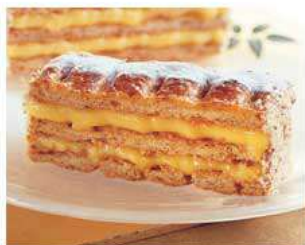
D5. MILLEFOGLIE € 5,00