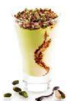
D18. COPPA CREMA E PISTACCHIO € 5,00