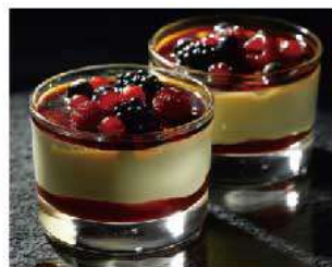
D7. CREMA BRULEE E FRUTTI DI BOSCO € 5,50