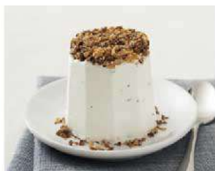
D11. SEMIFREDDO AL TORRONCINO € 4,50