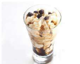
D23. COPPA CAFFÈ € 5,00