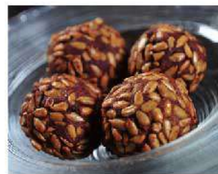
D9. PALLINA DI SOIA IN GIRASOLE € 4,00