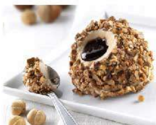
D20. TARTUFO NOCCIOLA € 5,00