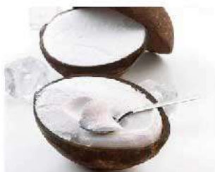
D19. COCCO RIPIENO € 5,00