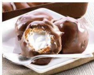
D6. PROFITEROL SCURO € 6,00