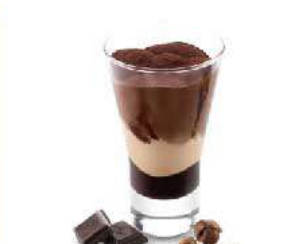
D17. COPPA CIOCCOLATO E NOCCIOLA € 5,00