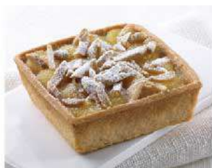
D10. TORTINA DELLA NONNA € 4,00