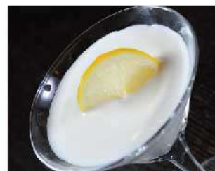
D13. SORBETTO AL LIMONE € 4,00