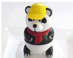
D14. PAN PAN € 5,00